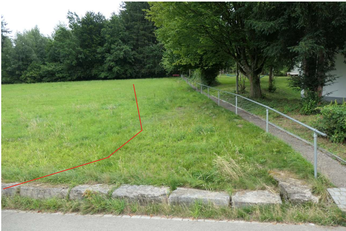
Geplante Baustraße entlang Fussweg