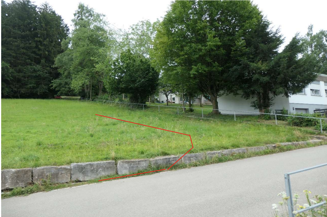
Schulstraße, Beginn geplante Baustraße