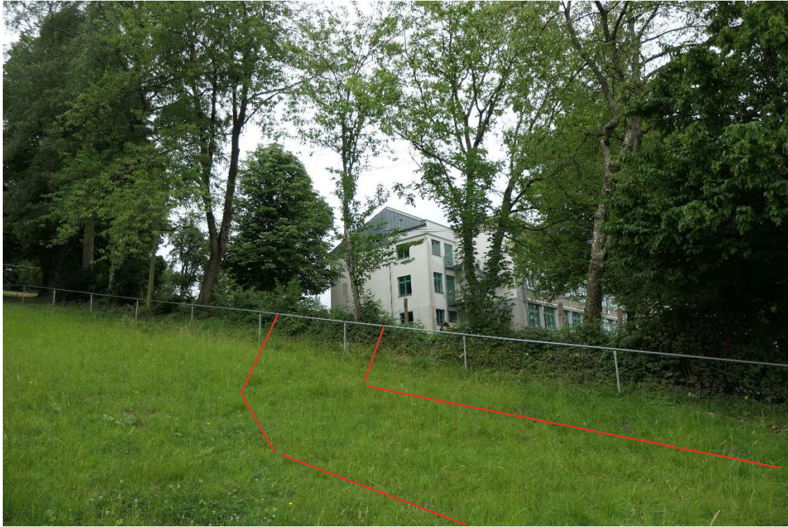
Zufahrt Baustraße zum Bauquartier, Höhe Baustellenkran